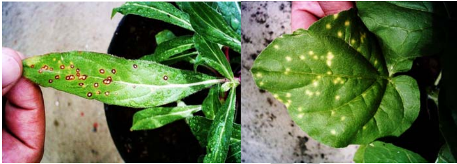
شکل ۳- A: واکنش لکه موضعی نکروتیک در Gomphrena globosa و B: کلروتیک در Nicotiana glutinosa .