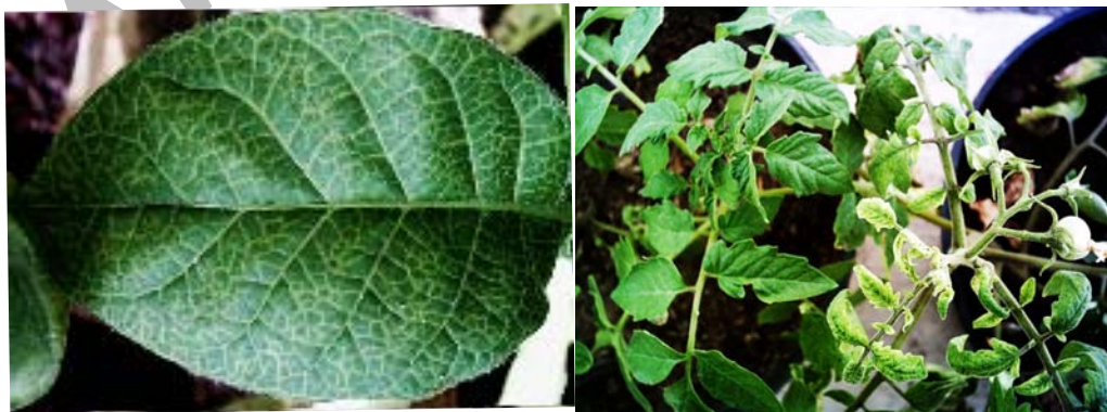
شکل ۵- روشن شدن رگبرگ در اثر مایه‌زنی EMDV در A: N. tabacum var. Turkish و B: در گوجه‌فرنگی.