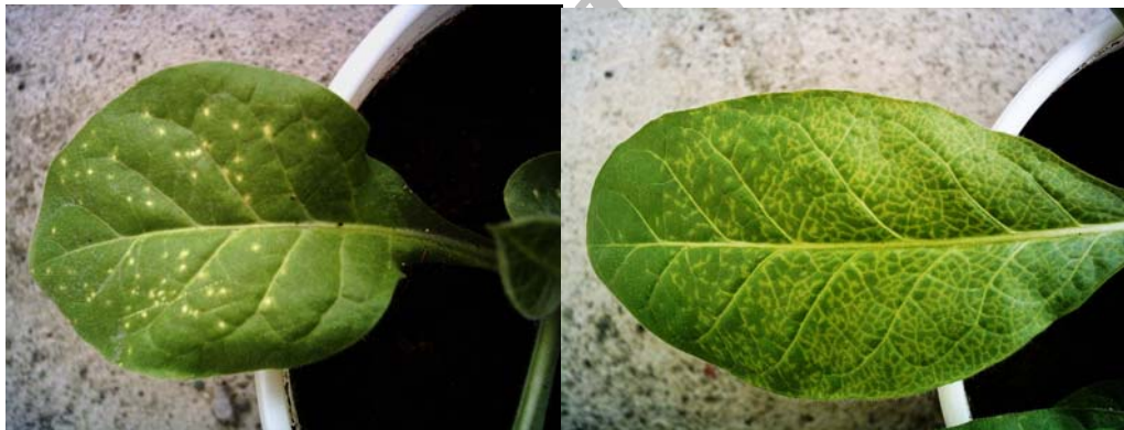
شکل ۴- A: تشکیل لکه کلروتیک درخشنده در برگ مایه‌زنی شده و B: روشن شدن رگبرگ و سیستمیک شدن بیماری در N. tabacum var. Havana .