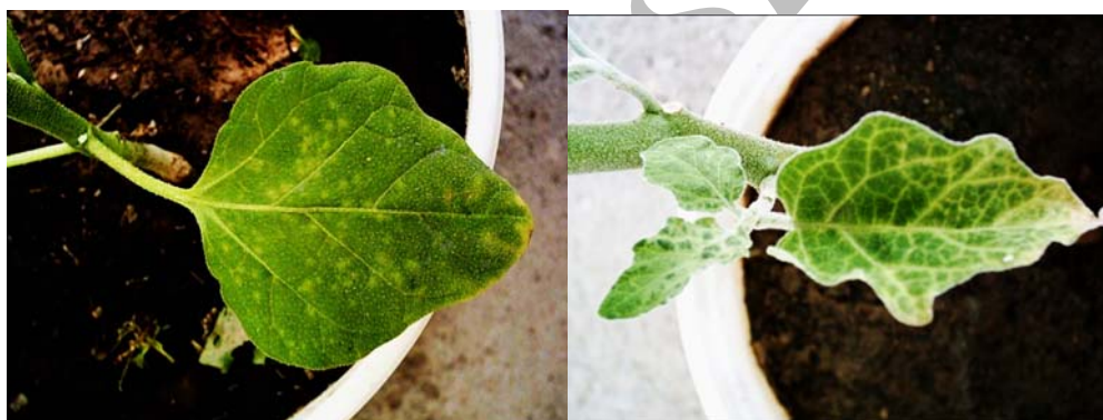
شکل ۷- A: ایجاد لکه کلروتیک در برگ مایه‌زنی شده و B: زردی رگبرگ و سیستمیک شدن بیماری در اثر مایه‌زنی ویروس در بادمجان.

نشان داد که تمامی جدایه‌های شناسایی شده در یک گروه سرولوژیکی و سروتیپی قرار می‌گیرند و از این نظر تفاوتی را نشان ندادند (شکل ۸).