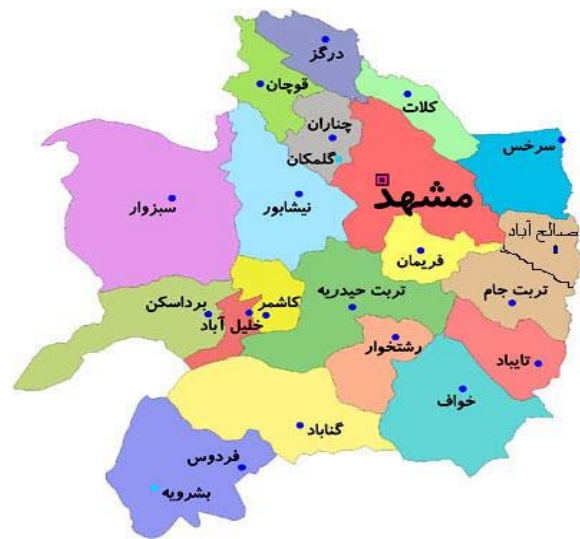
(نقشه ۱- موقعیت صالح آباد در خراسان رضوی)

اساس برای شناسایی و جمع آوری فون سوسماران این منطقه به مطالعه آنها پرداختیم.