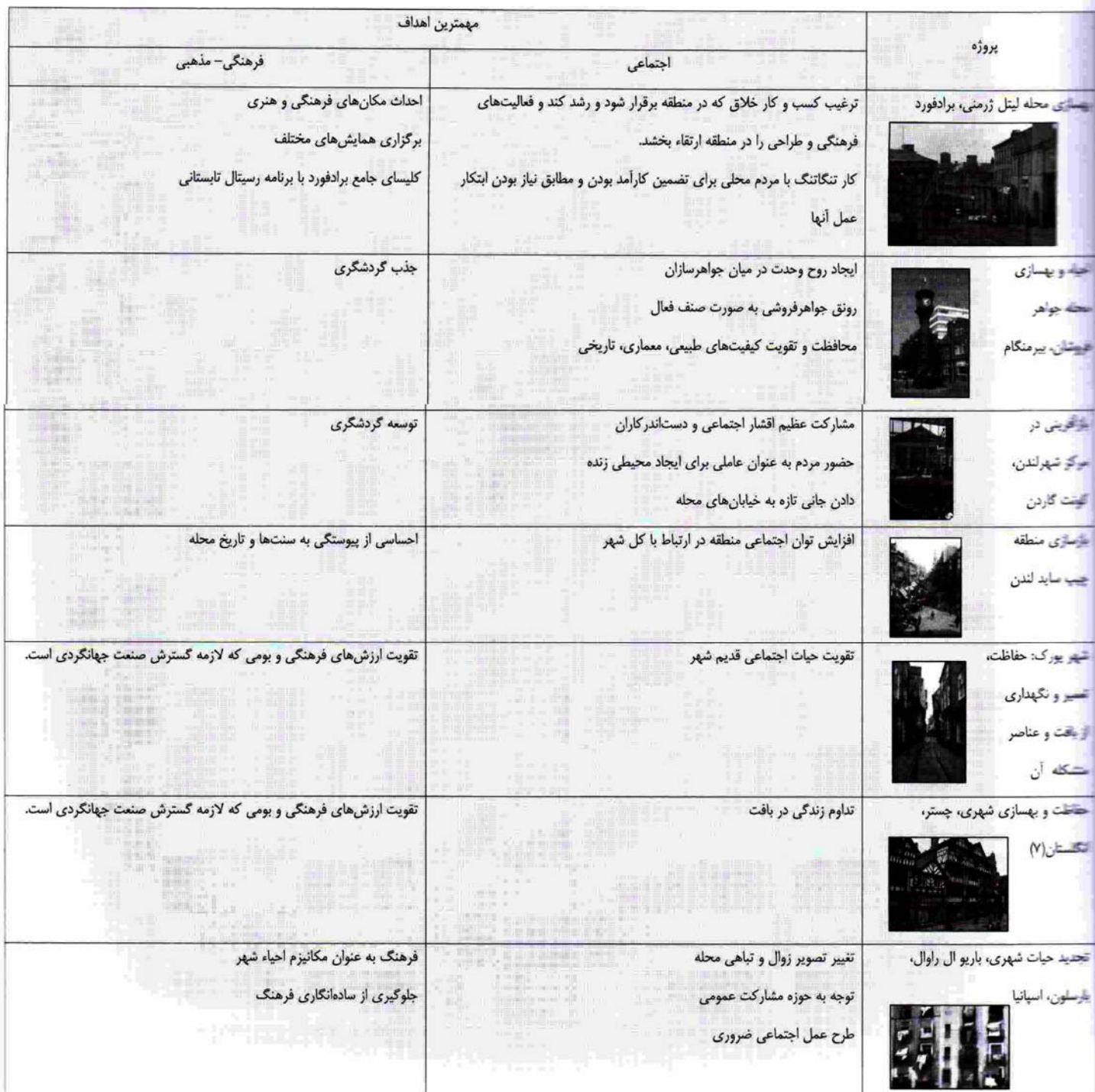
جدول ۱: بررسی تطبیقی پروژه‌های مرمت شهری در کشورهای توسعه یافته

در این مقاله در ابتدا به صورت تحلیلی، منابع علمی این حوزه بازخوانی شد، نمونه‌هایی که از لحاظ تکرار یا فراوانی تعداد تنوع زیادی داشته و از مهمترین فعالیت‌ها و اقدامات در حوزه مرمت شهری بودند انتخاب گردیدند و با استفاده از روش تحقیق مورد پژوهی و راهکارهای ترکیبی مورد تجزیه و تحلیل قرار گرفتند. نتیجه‌گیری نهایی نیز حاصل جمع‌بندی‌های قبلی و دستاوردهای حاصل از نمونه‌های موردی تحلیل شده می‌باشد. به همین سبب روش تحقیق استدلال منطقی برای این بخش در نظر گرفته شده است.