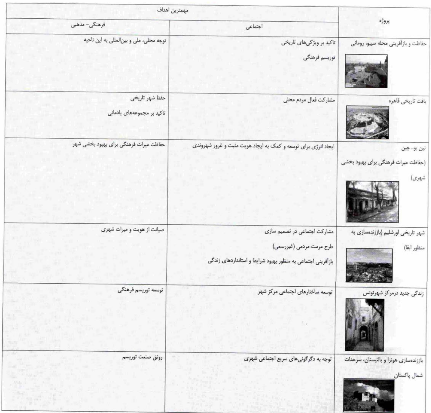
جدول ۲: بررسی تطبیقی پروژه‌های مرمت شهری در کشورهای در حال توسعه

■ تجربه‌های ایرانی: طرح بهسازی و نوسازی پیرامون حرم مطهر امام رضا (ع) ۱۳۷۸؛ طرح حفظ، احیا و بهسازی بافت تاریخی سمنان؛ محلات اسفنجان و ناسار ۱۳۶۸؛ احیای مجموعه کریمخانی شیراز ۱۳۷۱؛ طرح بهسازی و نوسازی محله فیض‌آباد کرمانشاه ۱۳۷۶؛ مرمت شهری در محورهای فرهنگی تاریخی اصفهان؛ جماله ۱۳۷۹؛ و غیره مورد بررسی قرار گرفته‌اند. بیست نمونه شاخص از کشورهای توسعه‌یافته، در حال توسعه و تجربه‌های ایرانی در نظام مدل تحلیلی تطبیقی حاصل، در جداول ۱ و ۲ مورد بررسی قرار گرفته‌اند.