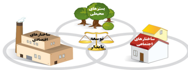
شکل ۱. پیوند و همپوشانی اجزای پایداری