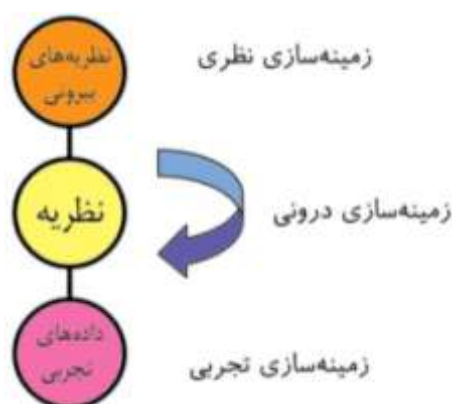
شکل شماره‌ی ۳- سه منبع مکمل زمینه‌سازی برای توسعه‌ی نظریه (منطبق بر گلدکوئیل، ۲۰۰۴)

تمرکز این نظریه مربوط به منابع دانش و اطلاعات گوناگون آن است. این نوع اطلاعات هم برای خلق نظریه و هم تضمینی برای اعتبار آن است. زمینه دار کردن به معنای فراهم کردن دلیلی برای توجیه مسئله است (Merriam-Webster, 2010). در این روش، فقط بر داده‌های زمینه‌دارشده‌ی تجربی (مانند روش نظریه‌ی مفهوم‌سازی بنیادی) تکیه نمی‌شود، بلکه در کنار آن به دیگر منابع اطلاعاتی هم نیاز است. انتقادی که قبلاً بر نظریه‌ی مفهوم‌سازی بنیادی وارد شد این بود که این روش هم از نظر تجربی و هم از نظر نظری بسیار نامتمرکز است و ممکن است سؤالات تحقیق بسیار مبهم باشد. در نظریه‌ی مفهوم‌سازی بنیادی چندگانه بسیار مهم است که، به طور مداوم، انگیزه و منفعت بررسی را در تحقیق منعکس کنیم. ممکن است در این روش سؤال تحقیق باز باشد، اما هدف تحقیق نسبتاً دقیق تعریف می‌شود. اگر مهم