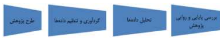
شکل شماره ۱- فرایند تدوین نظریه‌ی مفهوم‌سازی بنیادی

روش‌ها، آزمودنی‌ها و غیره، برای تضمین تعمیم‌پذیری سالم و مطمئن، به اندازه‌ی کافی مشابه شرایطی است که نخستین بررسی در آن انجام یافته است یا خیر (هومن، ۱۳۸۵).