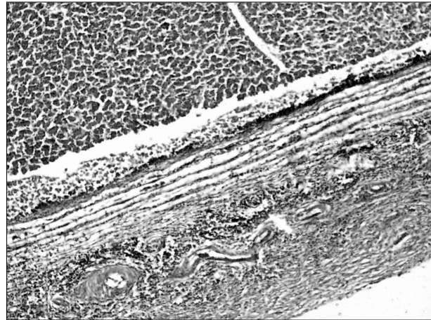
تصویر ۱- حد فاصل بین پارانیشیم نرمال کبد (قسمت بالا) و ناحیه وسیع فیروزی که سلولهای آماسی در آن استقرار یافته‌اند. (رنگ آمیزی هماتوکسیلین و انوزین ۴۰x).

مجاری صفراوی شباهت بسیار داشتند. هسته سلولهای توموری با پلئومورفیسم واضح، کوچک، بزرگ، گرد یا کاملاً بیضوی و با تراکم شدید (هایپرکروماتیک) حجم قابل ملاحظه‌ای از سیتوپلاسم را پوشانده و در قاعده سلولهای آسینی قرار داشتند. سیتوپلاسم سلولها کاملاً اتوزینوفیلیک، با مرز سلولی نامشخص و با ظاهری هرمی تا مکعبی مشخص بودند. اشکال میتوزی به ندرت مشاهده گردیدند.