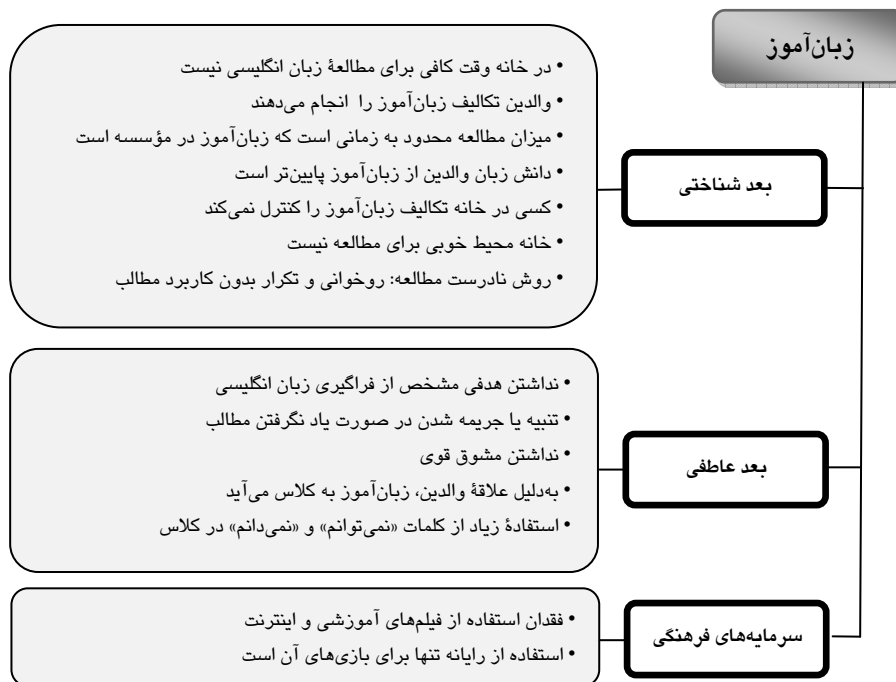
شکل ۲ طبقه‌بندی مشخصه‌های آموزشی رایج در زبان‌آموزان ضعیف

شکل ۲ شامل مواردی است که از مصاحبه‌های زبان‌آموزان ضعیف مورد مطالعه این تحقیق استخراج شدند. همان‌طور که در شکل مشخص است محیط آموزشی مناسبی برای این زبان‌آموزان مهیا نشده است. زبان‌آموزان در بعد عاطفی که برخی معتقدند چراغ سبزی برای پیشرفت در بعد شناختی است (Goleman, 1995; Brown, 2007)، در وضعیت مساعدی نیستند. شایسته است که والدین میل و نیاز به یادگیری زبان را در فرزندان خود ارتقاء دهند و ابعاد عاطفی زبان‌آموز را تقویت کنند. در برخی از خانواده‌ها دیده می‌شود که یادگیری زبان انگلیسی وظیفه محسوب می‌شود