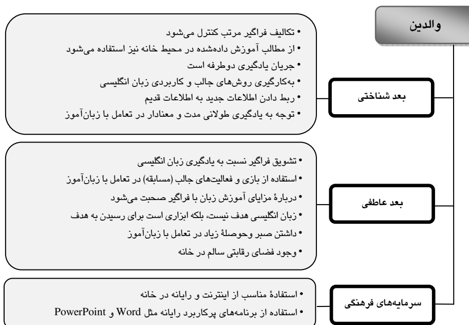
شکل ۵ طبقه‌بندی مشخصه‌های آموزشی رایج در والدین زبان‌آموزان قوی