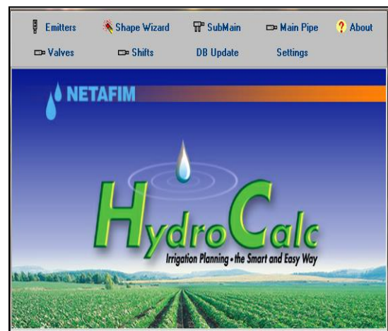
شکل ۲- نمایی از ورودی نرم افزار Hydrocalc

نرم‌افزار برنامه‌ریزی Hydrocalc برای بهینه کردن محاسبات هیدرولیکی در طراحی سیستم‌های آبیاری تحت فشار استفاده می‌شود. این نرم افزار ابزار محاسباتی ساده و آسان برای انجام محاسبات هیدرولیک پایه است (شکل ۲).