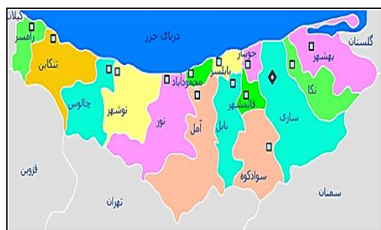
شکل ۱- موقعیت طرح ها در شهرستان های استان مازندران

اطلاعات پژوهش حاضر بر اساس طراحی های صورت گرفته برای سیستم های آبیاری قطره ای از ۱۴ باغ مرکبات واقع در شهرستان های مختلف استان مازندران از سازمان جهاد کشاورزی جمع آوری شده است (موقعیت ۱۴ طرح در شکل ۱ و وضعیت عمومی اراضی طرح در جدول ۱ نشان داده شده است). با استفاده از نرم افزار برنامه ریزی آبیاری Hydrocalc در این پژوهش به مقایسه طراحی های انجام شده و خروجی های بهینه از این نرم افزار پرداخته شده است. هدف از انجام آن کنترل هیدرولیکی سیستم های آبیاری تحت فشار به خصوص آبیاری قطره ای و بهینه سازی در مصرف آب برای طراحی توسط طراحان به روش (Emitter Line length (ELL است.