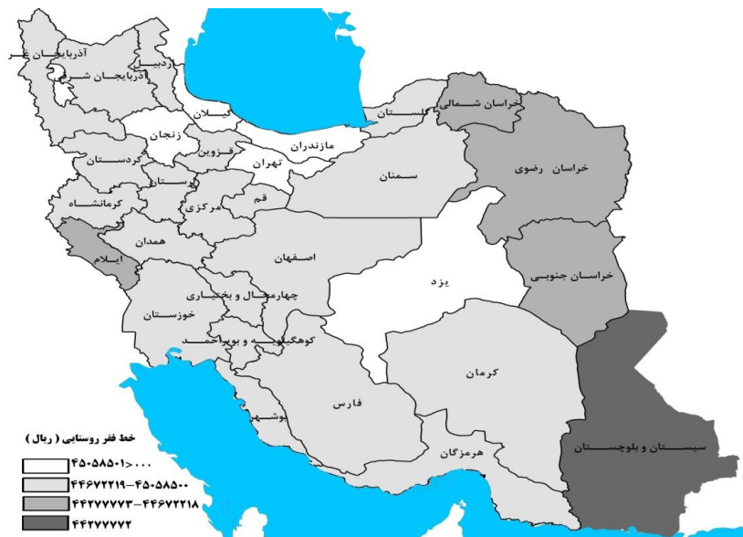
شکل 3- نقشه جغرافیایی خط فقر کشور در سال 1390

شکل 3، وضعیت خط فقر در مناطق روستایی استان‌های کشور را برای سال 1390 نشان می‌دهد. همان‌گونه که مشاهده می‌شود، خط فقر در روستاهای استان سیستان و بلوچستان کمترین مقدار و در روستاهای استان‌های تهران، گیلان، مازندران، زنجان، یزد و قم بیشترین مقدار را دارد.