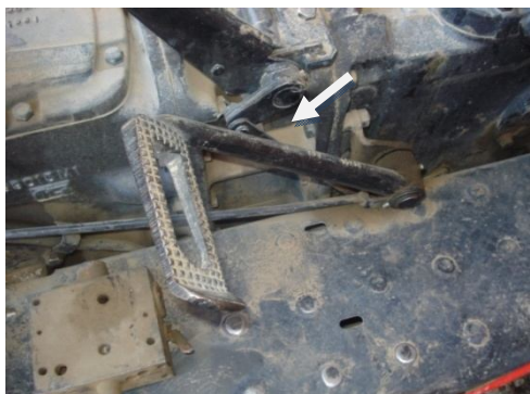
شکل ۳- مفصل انتقال نیرو بین پدال و دیسک در مکانیزم کلاچ‌گیری تراکتور MF285

راستای نیروی اعمال شده با اصطکاک بیشتری در مفصل خود چرخش کند. بر این اساس به شرکت سازنده این تراکتور پیشنهاد می‌شود برای کاهش نیروی ورودی برای کلاچ‌گیری تراکتور MF285 و رفاه حال بیشتر رانندگان تمهیدات لازم صورت گیرد. با توجه به این که این تراکتور جزو تراکتورهای سبک محسوب می‌شود و میزان تولید و استفاده از آن در بخش کشاورزی ایران به مراتب بیشتر از تراکتور MF399 است (AJMDC, 2012). توجه به بهینه‌سازی آن نقش بیشتری در بهداشت حرفه‌ای بخش کشاورزی خواهد داشت. به‌عنوان یک پیشنهاد مقدماتی توصیه می‌شود، مفصل انتقال نیرو بین پدال و دیسک در مکانیزم کلاچ‌گیری که در شکل ۳ نشان داده شده است، از چدن ریخته‌گری ساخته شود. زیرا اگر این قطعه از این جنس ساخته شود، هنگام اعمال نیرو به پدال، تغییر شکل قابل توجهی نداد و از صرف نیروی بیشتر جلوگیری می‌شود. آزمایش‌های مقدماتی نشان دادند که با انجام این کار بر روی مکانیزم کلاچ‌گیری تراکتور MF285 میزان نیروی مورد نیاز کلاچ‌گیری می‌تواند تا ۷۰ نیوتن کاهش یابد.