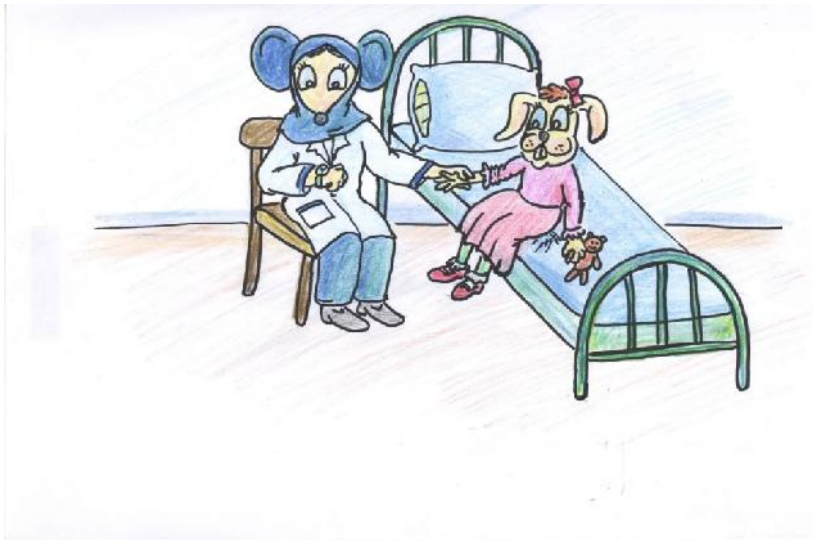
شکل ۴- نمونه ای از نقاشی های رو