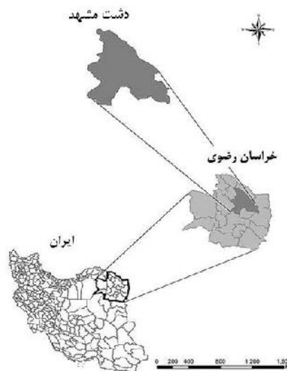
شکل ۱- موقعیت مکانی منطقه مورد مطالعه Figure 1- Geographical characteristics of study location

برای بارندگی و 0/5^\circ \times 0/5^\circ برای دمای حداقل و حداکثر). داده‌ها با فرمت ذکر شده قابل ورود به محیط R می‌باشند. جدول ۱ نشان داده مشخصات ایستگاه‌های سینوپتیک گل‌مکان و مشهد می‌باشد.