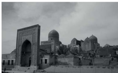
مجموعه آرامگاهی شاه زنده، سمرقند.