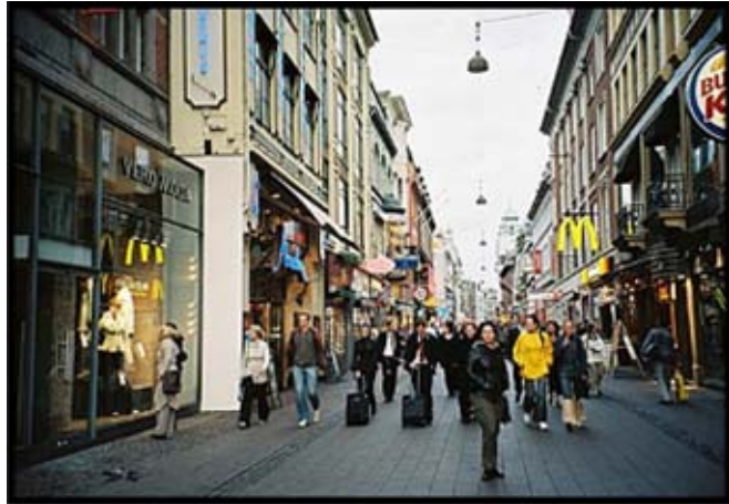
شکل ۴- پیاده راه اشتروگت کپنهاگ « Copenhagen »

گذر های چند طبقه: در منطقه مرکزی تجاری همیشه فضای کافی جهت تردد