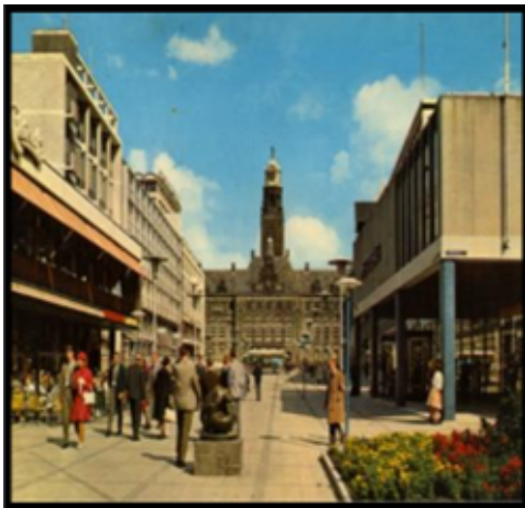
شکل ۶- پیاده راه آلمان، مونیخ « Munich, Germany »

طراحی و بهسازی پیاده راهها نیازمند برنامه و طرح