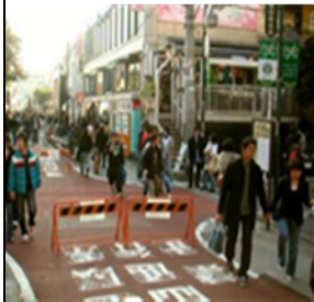
Yamanote Line, Tokyo, Japan