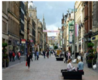
Buchanan Street, Glasgow, Scotland, UK