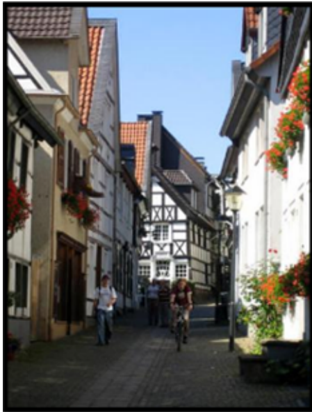
شکل ۵- پیاده راه آلمان، مونیخ « Munich, Germany »

ندارد. در چنین شرایطی گذر های غیر مسطح احداث می شوند (رادپویا، ۲).