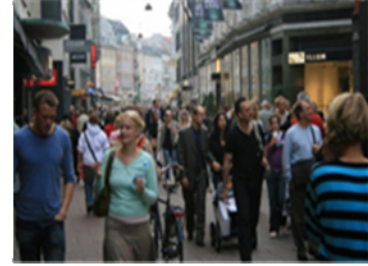
Strøget, Copenhagen, Denmark