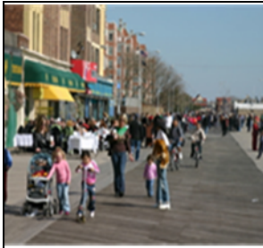
Brooklyn, NY, Brighton Beach