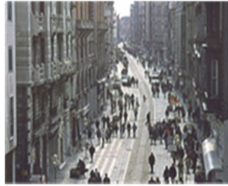
Istiklal, Istanbul, Turkey