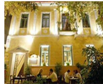
Psirri, Athens, Greece

شکل ۸- نمونه های موفق