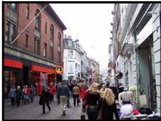
شکل ۱- فضای پیاده

در میان موارد بالا، خیابانهای پیاده یا به اصطلاح ایجاد مناطق ویژه عبور عابری (پیاده راهها) از جمله با نفوذترین جنبشهایی است که در مقوله طراحی خیابانها ایجاد و موجب بروز تغییرات اساسی در محیط و چهره بسیاری از شهرهای جهان شده است. این جنبش با توجه به این موضوع که در ابتدا و انتهای هر سفری که با وسیله نقلیه انجام می شود، پیاده روی وجود دارد، محدود ساختن ترافیک در