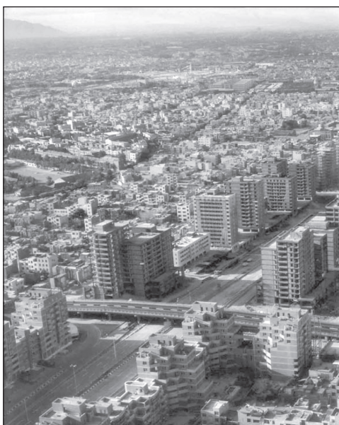
تصویر ۶: جداسازی عملکردی و نمادین محله توسط بزرگراه