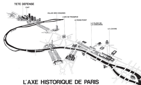
تصویر ۳: محور تاریخی شهر پاریس