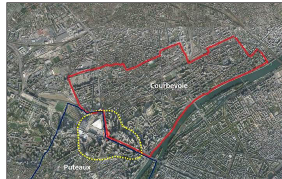
تصویر ۲: موقعیت لا دفانس بین دو جامعه محلی Puteaux و Courbevoie