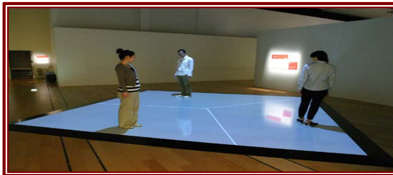
شکل ۱: مرزبندی بین انسان‌ها

توان گفت انسان‌ها در زمینه‌های مختلف معنوی و مادی با یکدیگر تفاوت دارند و این تفاوت سبب شکل دادن به مرزبندی بین آن‌ها می‌شود (شکل (۱)) (حافظنیا و جان‌پرور، ۱۳۹۲: ۲۸-۲۷).