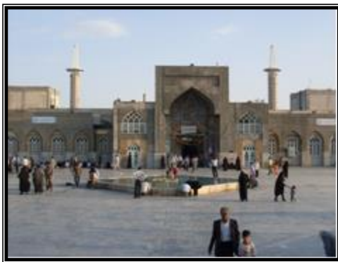
(امامزاده یحیی بن زید در روستای