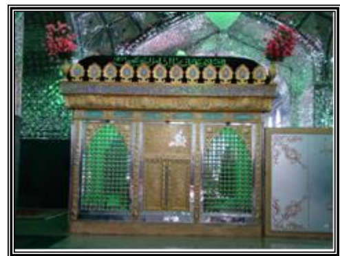
(ضریح امامزاده یحیی بن زید در روستای میامی)