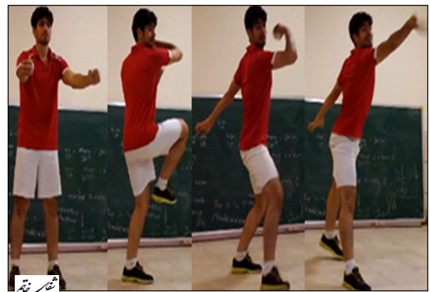
تصویر ۱- نحوه پرتاب توپ به سمت هدف که در فاصله ۵ متری فرد و روی دیوار قرار گرفته است.

به واسطه خم شدن زانو و لگن، خط میانی بدن را قطع می‌کند و همراه با آن دست راست با نزدیک شدن افقی شانه و خم کردن آرنج، هدف را نشانه می‌گیرد. در این حالت، فرد در وضعیت پرتاب بک‌هند قرار می‌گیرد. سپس بازو به سمت هدف کشیده شده و آرنج کاملاً باز می‌شود و پس از آن با باز شدن انگشتان دست، توپ به سمت هدف رها می‌شود. همراه با حرکت بازو، یک گام بلند به سمت جلو به وسیله پای همسو (که قبلاً در وضعیت خم لگن و زانو و به صورت معلق در فضا در آمده بود) انجام می‌شود. پرتاب کننده از اصول حلقه جنبشی باز بهره می‌برد. به این معنی که رسیدن به اوج سرعت باز شدن ساعد، پس از رسیدن به اوج سرعت بازو اتفاق می‌افتد، یعنی هنگامی که تنه به سمت جلو چرخیده است. همچنین قسمت پایینی تنه قبل از قسمت بالایی تنه به سمت جلو می‌چرخد. این تمایزات بین حرکات بخش‌های مختلف و به تأخیر انداختن حرکت بازو منجر به، به حداکثر رساندن سرعت پرتاب توپ می‌شود (۲۴).