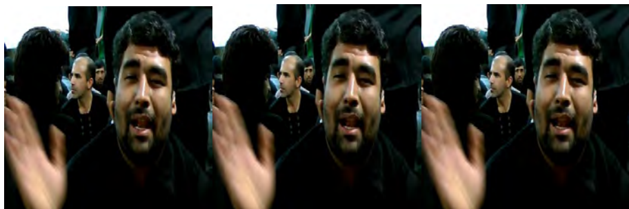
شکل (۱) اشاره "رفت و آمد"

"ده روز محرّم را به هیئت رفت و آمد می کردیم".