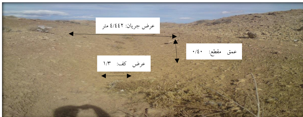
شکل ۱. نمایی از کانال درجه ۲ بلداجی

در این رابطه Q_r نسبت دبی مدل به نمونه اصلی می‌باشد. با توجه به هزینه اجرایی و زمان‌بر بودن انجام آزمایش‌ها در مدل‌های فیزیکی در مقایسه با مدل‌های ریاضی، مطالعات زیادی در این زمینه صورت نگرفته است. یاسی و عزیزپناه (۱۳۸۵) در تحقیقی با هدف مقایسه نتایج شبیه‌سازی جریان پایدار از مدل‌های ریاضی شناخته شده با نتایج نظیر از یک مدل فیزیکی رودخانه‌ای، مدل فیزیکی بستر ثابت یک بازه از رودخانه نازلو را طراحی، ساخته و مطالعه نمودند. نجف‌پور و همکاران (۱۳۹۳) مدلی فیزیکی از یک سد خاکی همگن در فلوم آزمایشگاهی با هدف بررسی الگوی عبور خطوط نشت و تعیین زاویه بهینه در طراحی زهکش پنجه‌ای، طراحی کردند. در برخی مطالعات نیز از مدل فیزیکی برای شبیه‌سازی رفتار هیدرولیکی جریان استفاده شده است؛ از جمله می‌توان به نوسانات سطح ایستابی و خصوصیات هیدرولیکی خاک در تهران (ولی سامانی و فتحی، ۱۳۸۴)، کنترل نشت از پی‌های آبرفتی در تهران (صدقی اصل و همکاران، ۱۳۸۹)، مدل‌سازی جریان نشت به چاه افقی در چین (Chen et al. , 2003)، بررسی جریان در آبخوان آزاد در نزدیکی یک مرز نشت در استرالیا (Simpson et al. , 2003)، پایداری سد در برابر نشت در چین (Xiangbao و Luofeng، ۲۰۱۲) و شبیه‌سازی نشت از یک سد خاکی براساس الگویی توزیعی