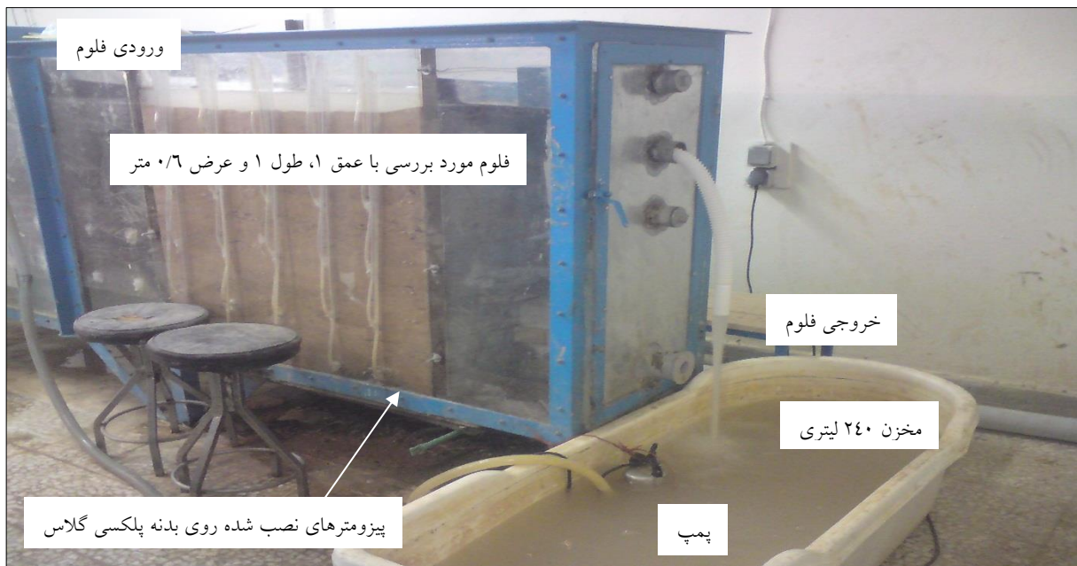
شکل ۲. مدل آزمایشگاهی، آزمایشگاه مکانیک خاک دانشگاه شهرکرد

روابط ۱ تا ۳ و با در نظر گرفتن (نسبت عرض سطح آب در مدل به عرض سطح آب در نمونه اصلی)، L_r=0.13 تعیین شد. برای به حداقل رساندن اثرات مقیاسی بر روی نتایج حاصل از مدل سازی فیزیکی، پارامترهای عدد رینولدز و عدد وبر کنترل و مشخص شد در بازه قابل قبول قرار دارند (عدد رینولدز برای دبی های مورد استفاده بزرگتر از ۱۰۵ و عدد وبر بزرگتر از ۱۰۰ به دست آمد) (Chanson, 2004).