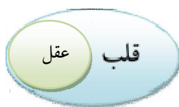
شکل ۲: رابطه عقل و قلب

و اتصال عقل به نفس را بیان می‌کند. که در روایت دیگری از رسول خدا(ص) نقل شده است که: «الْعُقْلُ نُورٌ فِي الْقَلْبِ يُفَرِّقُ بِهِ بَيْنَ الْحَقِّ وَالْبَاطِلِ» (دیلمی، ۱۴۱۲ق، ج ۱، ص ۱۹۸). باز عقل را نوری می‌دانند در قلب نه مقابل آن. در نقل دیگری آمده: رُوِيَ عَنْهُ (ص) أَنَّهُ قَالَ: «الْعُقْلُ نُورٌ خَلَقَهُ اللَّهُ لِلْإِنْسَانِ وَجَعَلَهُ يُضِيءُ عَلَى الْقَلْبِ لِيَعْرِفَ بِهِ الْفَرْقَ بَيْنَ الْمَشَاهِدَاتِ مِنَ الْمَغِيْبَاتِ» (ابن ابی‌جمهور، ۱۴۰۵ ق، ج ۱، ص ۲۴۸)، خداوند عقل را نوری آفریده که به قلب (یعنی روح انسان) نور می‌دهد. در حدیث دیگری از ابی‌جمیله نقل شده است که «الْعُقْلُ مَسْكَنُهُ فِي الْقَلْبِ» (کلینی، ۱۴۰۷ ق، ج ۸، ص ۱۹۰)، محل سکونت و استقرار عقل قلب است.