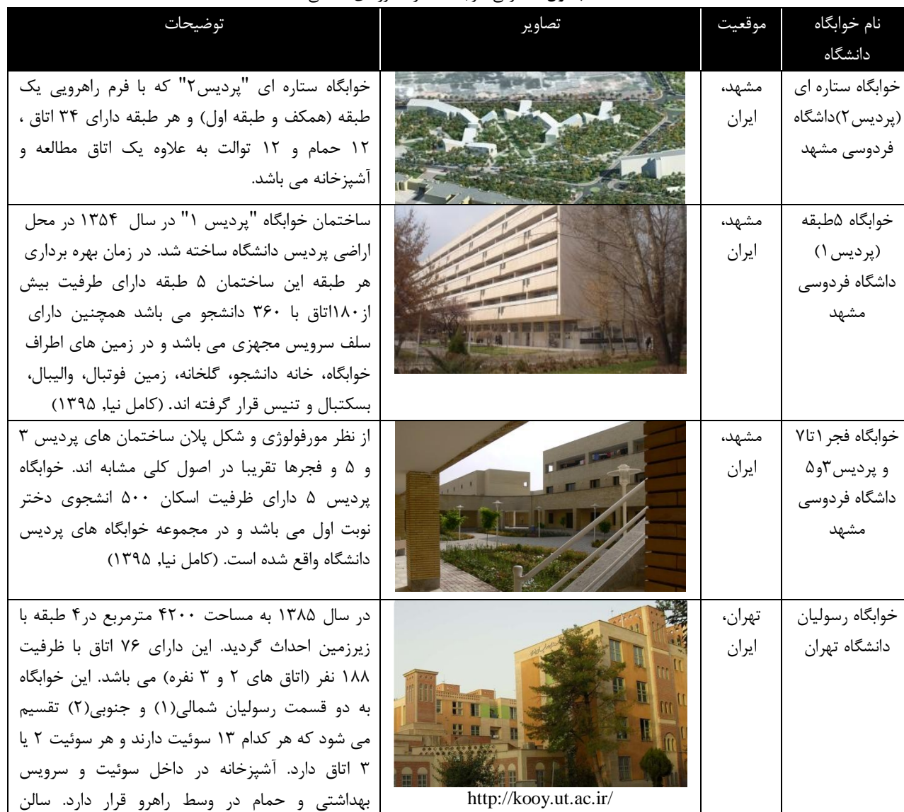
جدول ۲: معرفی خوابگاه ها در کشورهای اسلامی

همسالان نشان ایفا می کنند. (Bennett, Cochrane, Mohan, & Neal, 2016, pp. 4-12) فضاهای اقامتی موقت در دانشگاه ها به واسطه دانشجویانی که به جهان اجتماعی و فرهنگی متنوع تری متصل شده اند، به صورت گسترده تر تجربه می شوند، در واقع خوابگاه ها یکی از مهمترین موضوعات پیش روی دانشگاه ها و به خصوص مسئله اقامت دانشجویان بین المللی است. (کامل نیا، ۱۳۹۴) و این موضوع تاثیر مستقیم یا غیر مستقیمی بر عملکرد تحصیلی و رفتاری دانشجویان در بستر محیطی جدید خواهد داشت. (بهزاد بهبهانی، علی آبادی، سامانی، & پورنادری، ۱۳۹۰، ص. ۶۰) پیشینه اولین خوابگاه ها در جهان اسلام به محل آموزش و تعلیم و تربیت در مساجد باز می گردد به این ترتیب که حلقه های درس در اوقاتی غیر از اوقات نماز جماعت و وعظ تشکیل می شد که همزمان این مساجد آموزشی شامل امکاناتی برای اقامت و پذیرایی موقت برای کارگزاران و معلمان و متعلمان در غالب حجره ها بوده اند. (کامل نیا، ۱۳۹۴، ص. ۱۳-۱۶) در جدول ۲ نمونه هایی از خوابگاه های مورد ارزیابی در بستر کشورهای اسلامی و موقعیتشان به طور خلاصه ذکر شده است. همچنین نتایج مورد ارزیابی خوابگاه ها در بخش تحقیق و تحلیل و بررسی نوع واحد زندگی ترجیحی به کار گرفته شده است، که یکی از متدولوژی های موثر و کارآمد پژوهش حاضر در طراحی روش تحقیق به واسطه کاربرد نمونه های موردی پیشین می باشد.