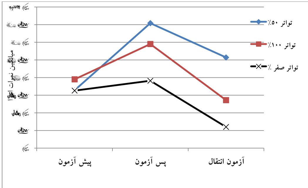
شکل ۲. میانگین نمرات عملکرد گروه‌های مورد مطالعه در طول تحقیق

اما به منظور مشاهده تفاوت‌های زوجی بین هر دو گروه در آزمون یادداری و انتقال از آزمون تعقیبی LSD استفاده شد. نتایج این آزمون