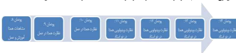
شکل (۲): مراحل تکمیلی توسعه حرفه‌ای

در این بخش تمرکز بر مشاهدات همکار برای ارائه و دریافت بازخورد در مورد آموزش آن‌ها است. پودمانی‌های ۸-۱۰ آنلاین برگزار خواهد شد. سه جلسه هم‌زمان همگانی بر یادگیری و تمرین پروتکل مشاهده با استفاده از ویدیوهای هم‌تایان متمرکز شده است. نظارت هم‌تا، پودمان‌های ۱۴-۱۱، هر هیأت‌علمی فرصتی را بحث در مورد دو ویدئوی ضبط شده از آموزش خود را خواهند داشت. این جلسات به همان شیوه جلسه تمرین تسهیل می‌شود، هرچند که می‌توانند به صورت فردی یا آنلاین رخ دهند. فیلم‌ها از دو استاد متفاوت در هر جلسه استفاده خواهند شد: (شکل ۲)