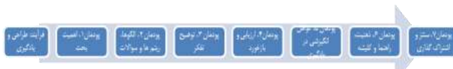
شکل (۱): مراحل مقدماتی توسعه حرفه‌ای