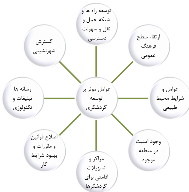
شکل ۱: عوامل موثر بر توسعه گردشگری

بردن سطح آگاهی مردم از طریق تبلیغات و اطلاع رسانی صحیح، مهمترین عامل رشد و توسعه صنعت توریسم می باشد. ۳- گسترش حمل و نقل باعث افزایش تعداد گردشگران خارجی می شود. ۴- توجه به زیر ساخت ها ۵- استفاده از تورگردانان، با پتانسیل زبان انگلیسی و ... ۶- آموزش تورگردانان و راهنمایان تور می باشد.