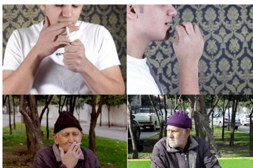
شکل ۱. نمونه‌ای از تصاویر استفاده شده در تکالیف سنجش و اصلاح شناخت ناآشکار

با توجه به اینکه ابزارهای سنجش و اصلاح شناخت‌های ناآشکار با استفاده از نرم‌افزارهای رایانه‌ای اجرا می‌گردد، لذا در پژوهش حاضر ابتدا آزمون‌های رایانه‌ای سنجش و اصلاح شناخت‌های ناآشکار توسط پژوهشگران تدوین گردید. به منظور طراحی آزمون‌ها و طرح پژوهش پروتکل‌های پژوهش‌های قبلی در زمینه اصلاح شناخت‌های ناآشکار مطالعه و در تدوین آزمون‌های پژوهش حاضر استفاده شد (مانند: بق و همکاران، ۲۰۱۳؛ آتوود و همکاران، ۲۰۱۴). در طراحی نرم‌افزارها تعدادی عکس و واژه استفاده شد. با الگو گرفتن از پژوهش استیپکوهل ۱ و همکاران (۲۰۱۰) در ابتدا عکس‌های مرتبط با سیگار توسط یک عکاس گرفته شد (مانند فرد در حال سیگار کشیدن و یا سیگار روشن). سپس عکس‌هایی که از لحاظ منظره، جهت شکل و رنگ هم‌تا شده بودند (شکل ۱)، بعنوان تصاویر خنثی گرفته شدند (مانند فرد در حال مسواک زدن و یا پاکت آدامس). نرم‌افزارها ابتدا بصورت پایلوت بر روی ۱۰ فرد سیگاری اجرا گردید. پس از آن ایرادات جزئی هر نرم‌افزار اصلاح گردید.