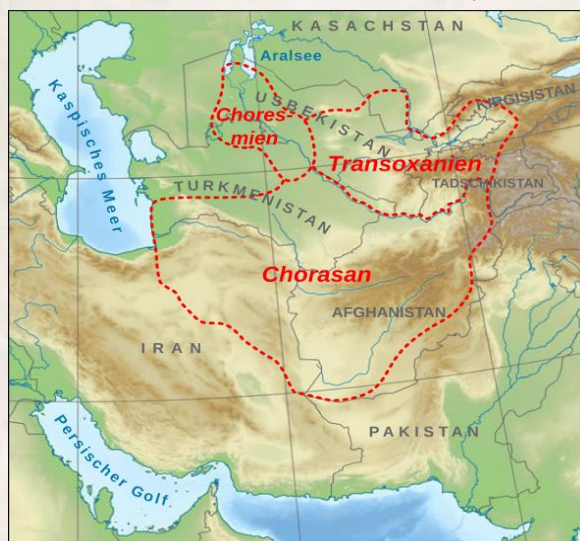
تصویر ۱. جغرافیای سغد و خوارزم.