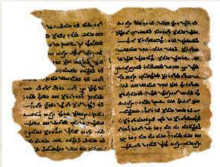
تصویر ۴. متن خوارزمی.

بنابراین معلوم است که این زبان به غیر از استفاده واژگانی در آثار علمی به زبان‌های دیگر، قابلیت انتقال علمی و دانش پزشکی را به مانند زبان عربی و فارسی دری نداشته است و این زبان جزء زبان‌های بومی و سنتی این منطقه بوده است. آنچه در خوارزم از میان رفته جز یک سلسله آثار ادبی و مذهبی زردشتی که از محتوای این نوع کتب مذهبی آگاهی داریم نبوده و ابوریحان هم بیش از این نگفته است. با این وجود به تعبیر دکتر زهره زرشناس آثار باقیمانده علمی به‌ویژه پزشکی و داروسازی، حاوی بدنه اصلی واژگان موجود زبان خوارزمی می‌باشد. 18 (تصویر ۴)