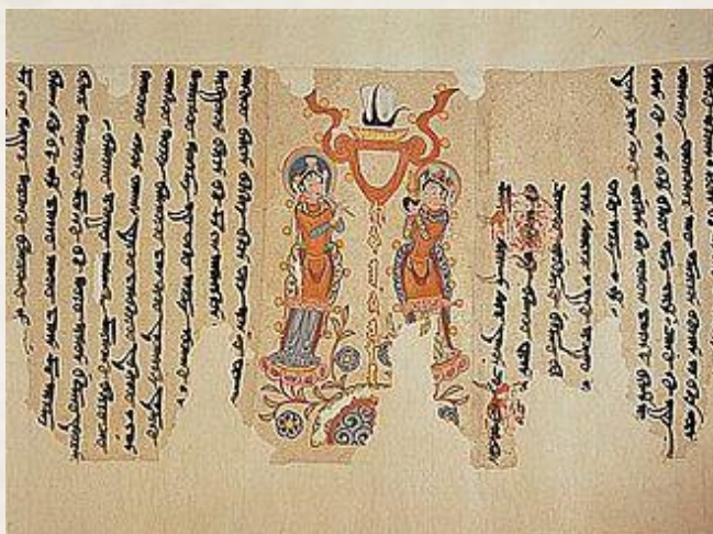
تصویر ۲. متن سغدی.