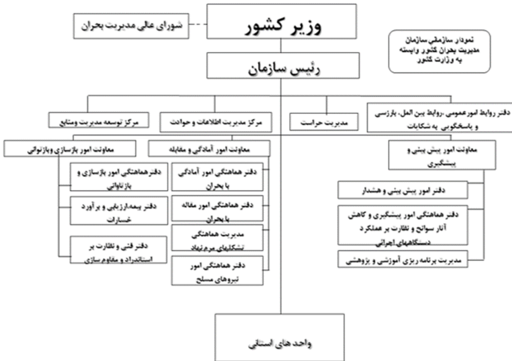
مدل اقتباس شده از سایت وزارت کشور