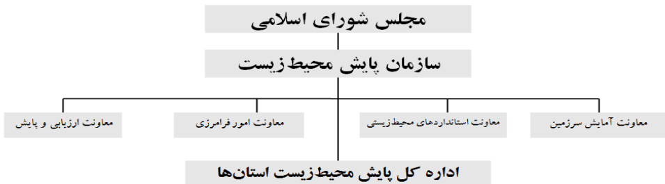
شکل ۳. ساختار مدیریت مسائل محیط‌زیستی

دهد، در مسائل فرامرزی و کنوانسیون‌ها نماینده کشور باشد و در نهایت ابزار ارزیابی اثرات محیط‌زیستی و پایش اجرای استانداردها را مهیا و به‌طور مستمر اعمال کند. این سازمان چون زیر نظر قوه مقننه است، می‌تواند تا حد ممکن از تلاطم‌های سیاسی و فردی در بخش اجرایی به دور باشد. نیز می‌تواند همچون دیوان محاسبات کشور که یکی از نهادهای نظارتی وابسته به مجلس شورای اسلامی است، به‌عنوان سازمانی با امور مالی و اداری مستقل، بر همه فرایندهای اجرایی کشور نظارت کند و به‌منزله بازوی نظارتی مجلس عمل نماید. اکنون بالغ بر ۵۴ سازمان/ نهاد در مورد محیط‌زیست و منابع طبیعی کشور تصمیم می‌گیرند. با این تغییر و تحول، «سازمان پایش محیط‌زیست» باید تنها نهاد نظارتی کشور در امور محیط‌زیستی - منابع طبیعی باشد؛ تقریباً همانند آنچه که سازمان حمایت محیط‌زیست آمریکا در کل ایالات متحده اعمال می‌کند.