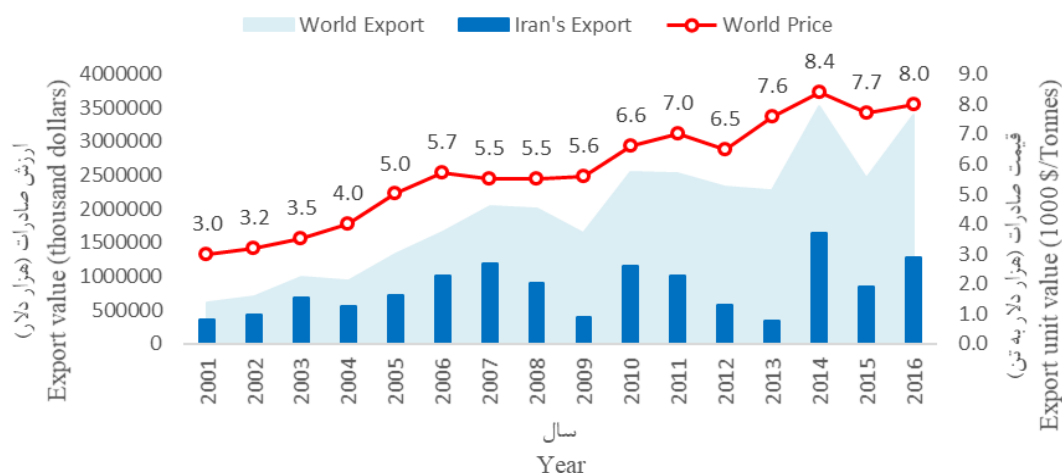
شکل ۲- ارزش صادرات ایران و قیمت صادرات جهانی، ۲۰۰۱-۲۰۱۶ Figure 2- Iran's export value and export unit value, 2001-2016 مأخذ: فائو (۱۸) Source: FAO

کشورها استفاده شد. فرم پایه و تئوریک الگوی جاذبه به صورت رابطه‌ی (۱) می‌باشد: