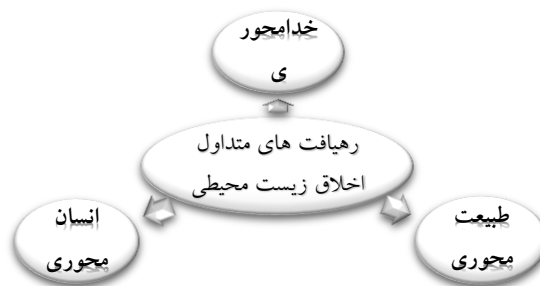
شکل ۲- رهیافت‌های متداول اخلاق زیست‌محیطی

رهیافت‌های متداول اخلاق سبز شامل: ۱- نظریه بوم‌محور که همه موجودات کره زمین را با ارزش و به تبع آن، دارای شأن و حق اخلاقی می‌داند و ۲- نظریه عالم‌محور که همه موجودات عالم را ارزشمند و برخوردار از حق اخلاقی می‌داند و ۳- نظریه خدامحور که حفظ طبیعت را به دلیل امانت الهی بودن ضروری می‌داند، است (فتحعلی، ۱۳۹۰).