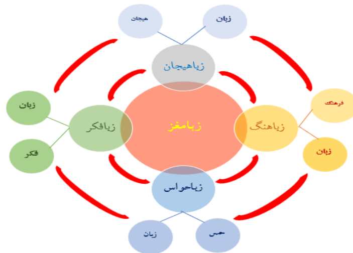
شکل ۱: الگوی زبانمغز (پیش‌قدم و ابراهیمی، ۱۳۹۹، ص. ۹)