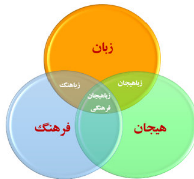
شکل ۱: زباهیجان فرهنگی

با توجه به موارد اشاره‌شده و اهمیت هیجان‌ها در انعکاس تفکرات، زبان و فرهنگ هر جامعه، نگارندگان در پژوهش حاضر مفهومی به‌نام زباهیجان‌های فرهنگی را معرفی می‌کنند که به هیجان‌هایی اشاره دارند که در پشت عبارت‌های زبانی نهفته هستند و در یک فرهنگ خاص ممکن است معانی منحصربه‌فرد خود را داشته باشند. با معرفی زباهیجان می‌توان بعد هیجانی را به الگوی قوم‌نگاری ارتباط افزود و آن را به قوم‌نگاری هیجانی ارتباط بسط داد. این مهم شکاف میان مطالعات جامعه‌شناسی و روان‌شناسی را کم‌رنگ می‌کند. شکل ۲ رابطه میان زبان، فرهنگ و هیجان را به‌خوبی به‌تصویر می‌کشد: