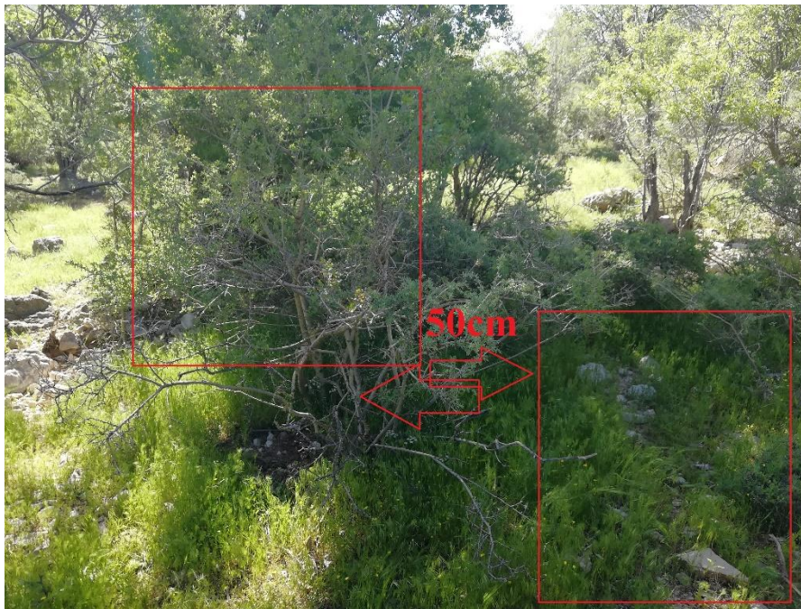
شکل ۱. نمای شماتیک از نحوه نمونه‌برداری در پلات‌های زوجی

بوده است به طوری که پلاتی به ابعاد تاج پوشش گونه بوت‌های A. brachycalyx در نظر گرفته شد و به اندازه ابعاد بوته، در فضای باز مجاور در فاصله ۵۰ سانتی متری برای نمونه‌گیری بانک بذر خاک استفاده شد (شکل ۱). در امتداد ترانسکت‌ها و در هر پلات یک مترمربعی یک نمونه خاک از دو عمق صفر تا ۵ و ۵ تا ۱۰ سانتی متری خاک با استفاده از آگر به قطر ۷ سانتی متر برداشت شد [۵۰]. سپس