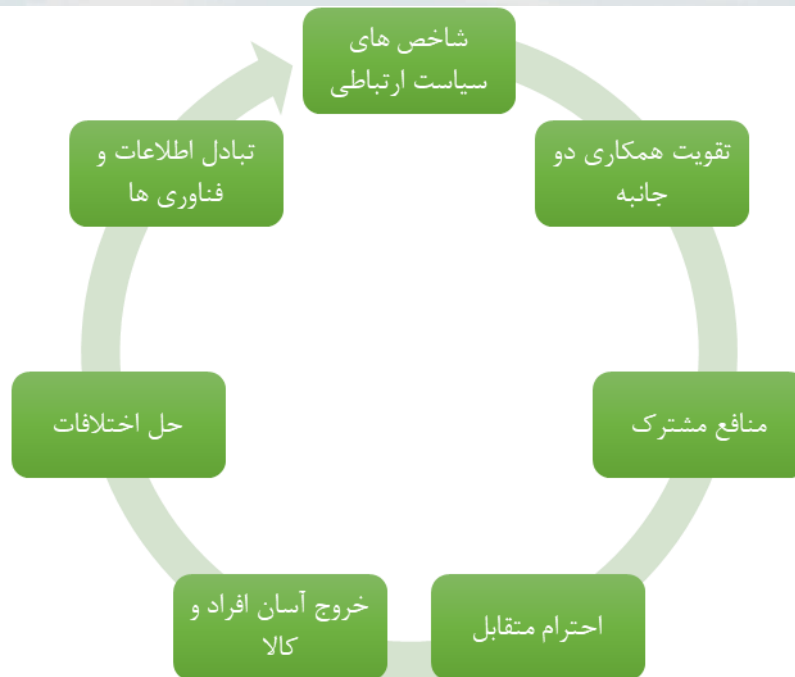
شکل ۳: شاخص های موثر سیاست ارتباطی