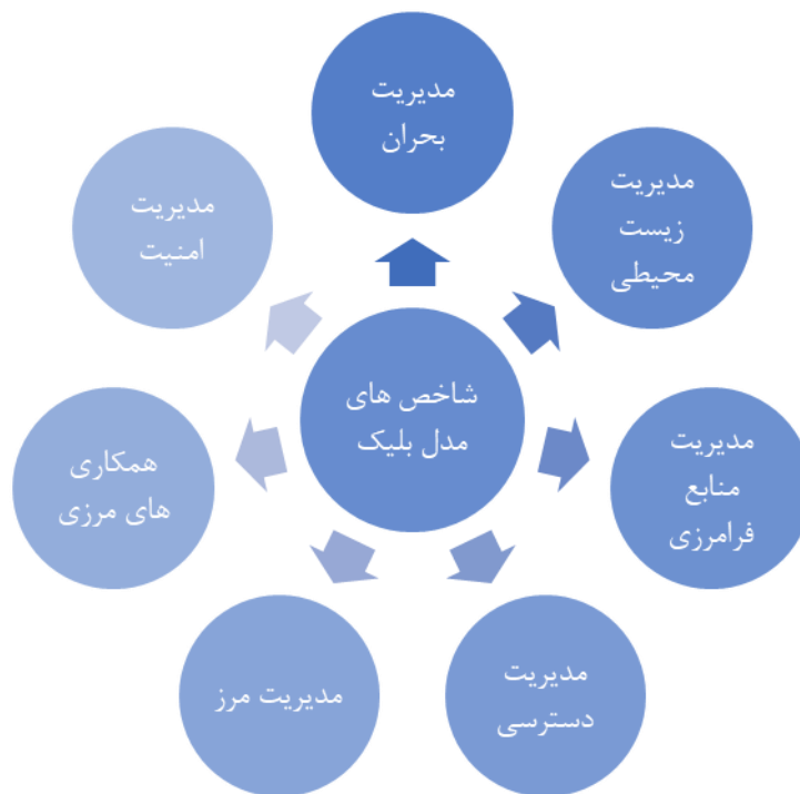
شکل ۲: شاخص های مؤثر مدیریت مرزهای زمینی بلیک

در مدل مرزهای زمینی بلیک می توان دید که مسائل زیست محیطی و منابع مشترک مانند (جنگل، رودخانه و...) در مناطق مرزی چقدر حائز اهمیت است. باتوجه به این نظریه بلیک شاخص های تاثیرگذار آن در قالب شکل ذیل آورده شده است. که توجه به این شاخص ها می تواند دست یابی به یک برنامه ریزی مشخص و درست را رقم بزند.