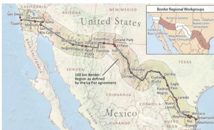
شکل (۳): نقشه منطقه مرزی ایالات متحده - مکزیکی