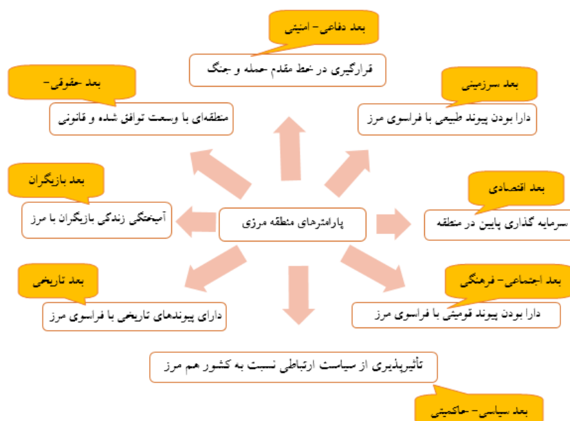
شکل (۴): مدل مفهومی مولفه‌های موثر بر تشکیل‌دهی منطقه مرزی

کشورها قرار دارند. یا مثلاً دارا بودن پیوند قومیتی با فراسوی مرز در بعد اجتماعی - فرهنگی نیز نمی‌تواند به تنهایی شکل‌دهنده منطقه مرزی باشد؛ چرا که مثلاً دو کشور هند و پاکستان از لحاظ مذهبی بسیار باهم متفاوت هستند ولی مناطق مرزی مشترکی با یکدیگر دارند. در مجموع باید گفت که منطقه مرزی به جایی گفته می‌شود که بتواند تعداد بیشتری از مولفه‌های شکل‌دهنده منطقه مرزی را در خود جای دهد.