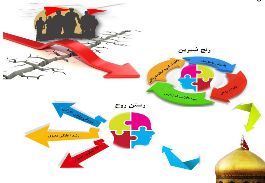
نمودار شماره (۳). از رنگ شیرین تا رستن روح

۷. مدرسه اربعینی در مقایسه با آموزش رسمی اثربخش‌تر است؛ چراکه تغییر رفتار و نگرش آنان بیش از آنکه متأثر از آموزش‌های رسمی باشد، تابع حضور رودررو و لحظه‌به‌لحظه با موقعیت‌ها و شرایط عینی است (سعیدی رضوانی و باغگلی، ۱۳۸۹: ۱۲۲؛ به نقل از اسکندری، ۱۳۸۳).