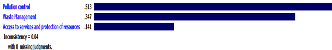
شکل ۳- رتبه‌بندی عامل‌ها.