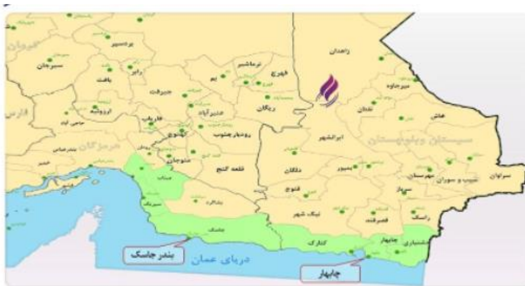
شکل ۱- منطقه مورد مطالعه (Sistan and Baluchestan Governor's Portal, 2020).

تعداد ۲۳۲ نفر انتخاب شدند. اطلاعات تحقیق از طریق پرسشنامه و مصاحبه حضوری جمع‌آوری و تکمیل گردید. محاسبه روایی پرسشنامه به صورت روایی-محتوایی و بر مبنای نظر خبرگان و کارشناسان صورت پذیرفت و به منظور تعیین پایایی آن نیز از روش آلفای کرونباخ بر روی ۳۰ پرسشنامه به روش پیش‌آزمون در نرم‌افزار SPSS استفاده شد که مقدار آن برابر ۰/۸۸ به دست آمد که نشان‌دهنده هماهنگی درونی مناسب برای پرسشنامه و پایایی آن بود. همچنین روایی پرسشنامه‌ها نیز به دو صورت مد نظر قرار گرفته است. ابتدا اینکه تلاش شده عمده شاخص‌ها از مطالعات نظری پیشین استخراج شود و در ادامه به تأیید ۱۰ نفر از کارشناسان و متخصصان ذی‌ربط رسید. افزون بر آن به منظور بررسی نرمال بودن شاخص‌های مورد مطالعه، از خطای استاندارد ضرایب چولگی و کشیدگی استفاده شده است. با توجه به آن که هرچه مقدار چولگی و کشیدگی کمتر باشد (بین -1/5 تا +1/5 ) احتمال نرمال بودن توزیع داده‌ها بیشتر و هرچه مقدار خطا کوچک‌تر از -2 و یا بزرگ‌تر از +2 باشد، احتمال نرمال بودن داده‌ها کمتر خواهد بود. با توجه به نتایج حاصل می‌توان بیان نمود که کلیه شاخص‌های مورد مطالعه نرمال می‌باشند. در ادامه به منظور تحلیل نتایج حاصل از پرسشنامه‌ها نیز از نرم‌افزارهای آماری، Excel نسخه