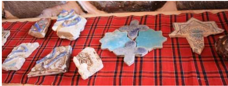
تصویر ۸. کاشی‌های زرین‌فام قلعه الموت

کاشی‌های زرین‌فام در آن دوره توسط بزرگان و برای بناهای مهم و ارزشمند به کار می‌رفت و بیشتر جنبه تزیینی داشت. احتمال می‌رود که کاشی‌های کتیبه‌دار به کتیبه‌های برجسته سر در قلعه تعلق داشته باشد؛ همان گونه که در نگاره جامع‌التواریخ نیز دروازه اصلی با کاشی‌های لعاب‌دار و کتیبه الملك لله تزیین شده است. با توجه به تشابه این کاشی‌ها با نگاره جامع‌التواریخ، می‌توان با الهام از این نگاره تصویری واقعی از قلعه الموت بازسازی کرد.