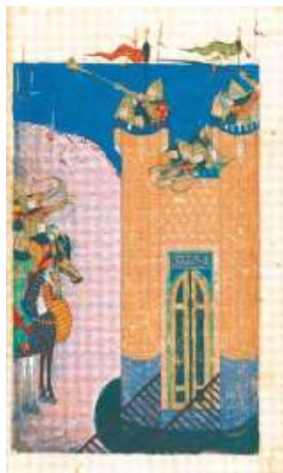
تصویر ۱۳. فتح قلعه الموت، تاریخ جهان‌گشای جوینی

تاریخ جهان‌گشای جوینی قدیم‌ترین منبع در میان کتب سنی‌مذهب ایرانی درباره یورش مغول است. این کتاب از منابع معتبر تاریخ مغول است؛ زیرا نویسنده شخصاً ناظر بسیاری از وقایع بوده و در مذاکرات مصالحه میان رکن‌الدین خورشاه و هلاکو شرکت داشته است. جوینی در جوانی به خدمت مغولان درآمد و هنگامی که مغولان الموت و دیگر قلاع نزاری را تسخیر کردند همراه آن‌ها بود. او شاهد حوادثی بود که به سقوط نزاریان منجر شد و چنانکه پیش‌تر اشاره گشت، او بود که کتابخانه الموت را از آسیب مغول نجات داد و زندگی‌نامه حسن صباح را در کتاب خویش آورد. با اینکه جوینی از دیوانسالاران مغول بود، اما در شرح وقایع از بیان حقایق ابایی نداشت. این اثر تاریخ سیاسی محض نیست، زیرا نویسنده هنگام شرح وقایع درباره اوضاع اقتصادی، اجتماعی و موقعیت جغرافیایی اماکن نیز توضیحات منحصربه‌فردی داده است.