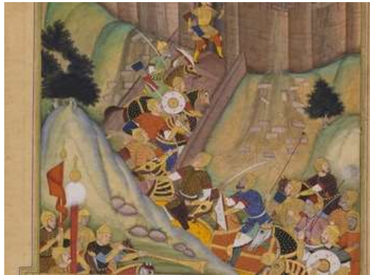
تصویر ۱۲. بخش پایین تصویر، خندق و موقعیت کوهستانی الموت

تنها دروازه و یگانه‌راه ورود به قلعه در انتهای ضلع شمال شرقی و مدخل راهی که به این دروازه منتهی می‌شود، چند متر پایین‌تر از برج شرقی و تقریباً در امتداد آن قدری به طرف شمال واقع شده است. در این محل تونلی به موازات ضلع جنوب شرقی قلعه در تخته‌سنگ پایه بریده شده است (ستوده، ۱۳۴۵: ۱۰۴). احتمالاً این همان گذرگاهی است که در نگاره بخش بالا و پایین تصویر را به هم متصل می‌کند.