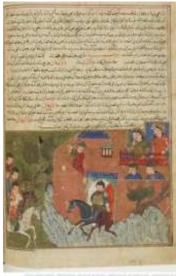
تصویر ۲. قلعه الموت

یکی از نسخ مصور جامع‌التواریخ خواجه رشیدالدین فضل‌الله همدانی، به شماره Sup ۱۱۱۳ Persan در کتابخانه ملی فرانسه نگهداری می‌شود. تاریخ این نسخه ۱۴۳۰ - ۱۴۳۴ م. / ۸۳۳ هـ است و نگاره‌هایی به سبک مکتب تبریز دارد. دست‌نویس مذکور تا دوره قاجار در ایران بود ولی در سال ۱۸۸۹ م. / ۱۳۰۶ هـ توسط کتابخانه ملی فرانسه خریداری شد (رک: سایت کتابخانه گالیکا).