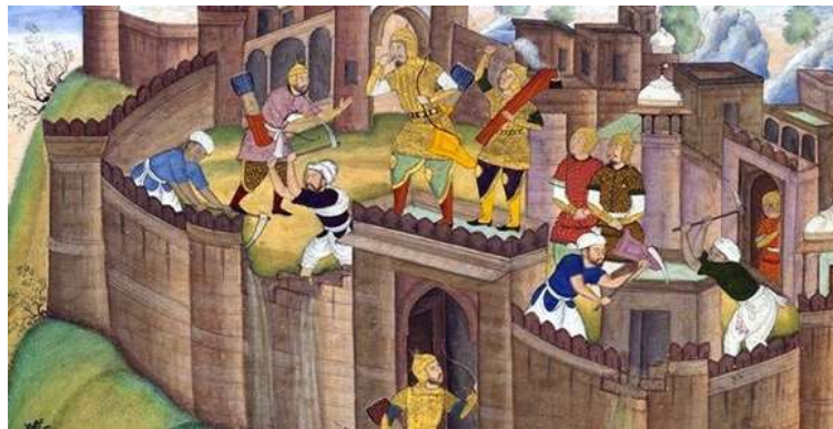
تصویر ۱۱. بخش بالای تصویر، قلعه الموت

جامه رزم بر بالای دروازه قلعه ایستاده است، در حالی که از عظمت و هیبت دژ حیرت کرده و انگشت تعجب به دهان گرفته است. چند نفر فاقد جامه رزم با تن پوش و آستین های بالازده، شالی سفید بر سر و پیشبندی بر کمر، قصد تخریب قلعه را دارند و تیشه و کلنگ به دست گرفته اند، دیوارها را در هم می شکنند و خشت و خاک را از فراز قلعه به سوی خندق فرومی ریزند. در گوشه راست مردی که لباس قرمز بر تن دارد در درون اتاقکی به دیوار تکیه زده است و گویی با تحسر ویرانی دژ را نظاره می کند (تصویر ۱۱).