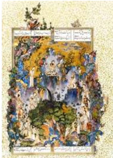
تصویر ۶. صخره‌های مرجانی در نگاره بارگاه کیومرث تصویر ۷. بزرگ‌نمایی صخره‌ها