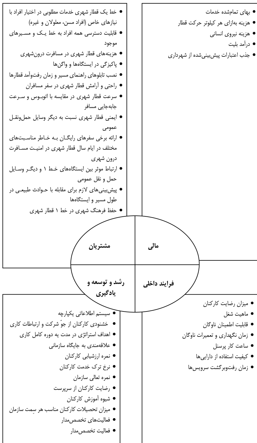
شکل ۳. معیارهای شناسایی‌شده توسط خبرگان شرکت بهره‌برداری قطار شهری مشهد