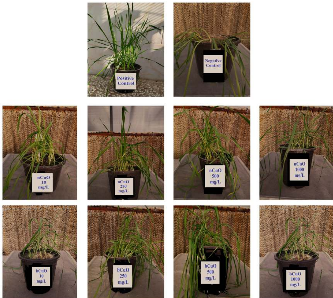
شکل ۱- نمایی از گندم (رقم روشن) طبیعی (کنترل مثبت)، گیاه آلوده به قارچ (کنترل منفی)، گیاهان تیمارشده با نانوذرات مس اکسید (nCuO) و گیاهان تیمارشده با فرم توده ذرات مس اکسید (bCuO).