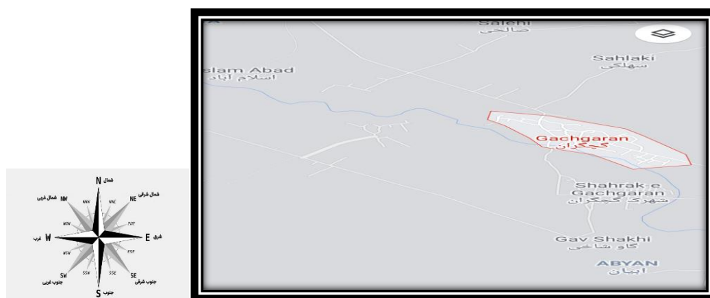
(Google Map, 2021)