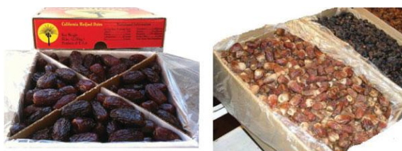
شکل (۱): جعبه‌ی راه‌راه با آستر پلاستیکی برای بازاریابی فله

میلارد و تانن است. محدودیت اکسیژن می‌تواند قهوه‌ای شدن آنزیمی را مهار کند. چندین روش برای جلوگیری از قهوه‌ای شدن آنزیمی استفاده می‌شود؛ از جمله حذف اکسیژن که معمولاً به‌وسیله‌ی فشار دادن خرما، ذخیره‌سازی در دمای پایین و ذخیره‌سازی در اکسیژن کم انجام می‌شود. برای مثال ذخیره‌سازی در اتمسفر نیتروژن یا دی‌اکسید کربن بالا. خرماهای فشرده عموماً به صورت سنتی در کوزه یا سید نگهداری می‌شوند. فشار دادن نه تنها مانع در معرض تبخیر قرار گرفتن رطوبت می‌شود؛ بلکه منجر به کاهش قهوه‌ای شدن نیز می‌شود و همچنان رشد میکروبی را محدود می‌کند.