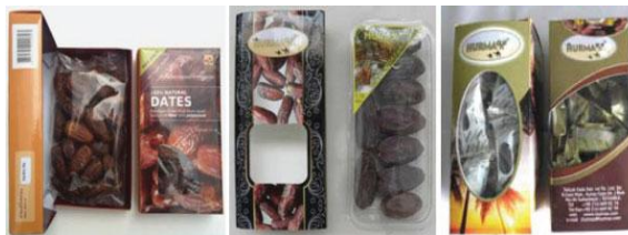
شکل (۳): بسته‌بندی خرده‌فروشی خرما در کارتن تاشو مقوایی (سمت چپ) / به‌عنوان بسته‌بندی ثانویه در کیسه پلاستیکی با رطوبت بالا به‌عنوان بسته‌بندی اولیه (شکل وسط) / خرماهای بسته‌بندی به‌صورت جداگانه، کارتن با پنجره‌ی مهر و موم شده (سمت راست)

بسته‌بندی ممکن است با تغییر محیط داخلی آن برای بهبود کیفیت محصول نقش فعال داشته باشد. نمونه‌های رایج بسته‌بندی فعال که برای میوه‌های تازه استفاده می‌شود، گیرنده‌های اکسیژن و اتیلن، گیرنده‌های کربن دی‌اکسید، و کنترل‌کننده‌های رطوبت