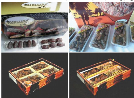
شکل (۲): ظروف راه‌راه بسته‌بندی خرده‌فروشی کوچک برای نمایش در فروشگاه‌های خرده‌فروشی

طیف وسیعی از نفوذپذیری به بخار آب و اکسیژن را دارند. پلاستیک به‌طور کلی یک ماده‌ی رقابتی است زیرا سبک وزن، مقرون‌به‌صرفه و نشکن است و همچنین در اشکال مختلف بسته بندی وجود دارد. مواد چند لایه برای افزایش عمر مفید محصولات استفاده می‌شوند. پلاستیک‌ها با خاصیت مانع‌شوندگی بالا برای اکسیژن (pet)، نایلون ۶MXD، اتیلن‌وینیل الکل ۱ (EVOH)، PVOH ۲ (پلی‌وینیل الکل) هستند. فیلم‌ها یا ورق‌های فلزی برای تشکیل ساختارهای چند لایه، سینی‌های پلاستیکی که عموماً از پلی‌اتیلن، پلی‌پروپیلن و پت ساخته می‌شوند کوآکستروید یا لمینیت می‌شوند. سینی‌های پلاستیکی از رایج‌ترین شکل‌های بسته‌بندی خرده‌فروشی هستند که برای بسیاری از محصولات و همچنین خرما استفاده می‌شوند. سینی‌های پلاستیکی ارزان، سبک وزن و آسان برای پردازش هستند سینی‌ها را می‌توان طوری طراحی کرد که دارای بسته‌های سلولی جداگانه برای محافظت از خرما باشند که معمولاً برای خرماهای ممتاز برای بازارهای پرفروش استفاده می‌شوند. برای بازارهای خرده‌فروشی بسته‌بندی خرماها در پلی‌استایرن رایج است. (شکل ۵) کیسه‌های پلاستیکی انعطاف‌پذیر اگرچه برای خرما کمتر رایج است اما به‌طور گسترده استفاده می‌شود. از کیسه‌های پلاستیکی پلی‌اتیلن به‌منظور مانع رطوبت برای خرما استفاده می‌شود. آب‌بندی خوب، قابلیت چاپ خوب و هم‌چنین هزینه‌ی کم این کیسه‌ها در حالت ایستاده یک شکل محبوب بسته‌بندی خرده‌فروشی انواع محصولات از جمله محصولات خشک است.