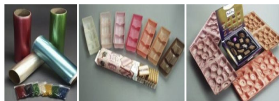
شکل (۲): محصولات تجاری مبتنی بر نشاسته

می‌شوند که در داخل سلولی به شکل گرانول‌های کروی با قطر ۲ تا ۱۰۰ میکرومتر ذخیره می‌شود. اکثر نشاسته‌های موجود در بازار از غلاتی مانند ذرت، برنج و گندم یا از غده‌هایی مانند سیب زمینی و کاساوا (تاپیوکا) استخراج می‌شوند. با بررسی ساختار، نشاسته یک پلیمر کربوهیدراتی متشکل از واحدهای انیدروگلوکز ۱ است که عمدتاً از طریق پیوندهای گلوکوزیدی آلفا-دی (۱-۴) به یکدیگر متصل شده‌اند [۲۳]. مطالعات قبلی نشان داده است که نشاسته یک ماده ناهمگن حاوی دو نوع ریزساختار است: خطی و شاخه‌ای. ساختار خطی به نام آمیلوز با واحدهای گلوکز با اتصالات آلفا (۱-۴) و ساختار منشعب به نام آمیلوپکتین که از زنجیره‌های کوتاه با اتصالات آلفا (۱-۴) گلوکز، که توسط پیوندهای آلفا (۱-۶) به هم متصل شده‌اند،