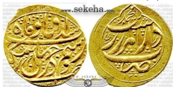
سکه آقامحمد خان

بیشترین سکه های «صاحب الزمانی» متعلق به آقا محمد خان قاجار (۱۱۹۳ - ۱۲۱۱ هـ) است وی ارادت خاصی به امام زمان داشت و بر سکه های وی شعائر شیعی بسیاری وجود دارد بر سکه های وی این شعائر وجود دارد: یا صاحب الزمان، به زروسیم تا نشان باشد / سکه صاحب الزمان باشد، تا زروسیم را نشان باشد / سکه صاحب الزمان باشد، تا زروسیم در جهان باشد / سکه صاحب الزمان باشد، شد آفتاب و ماه و زروسیم در جهان / از سکه امام بحق صاحب الزمان (شهبازی، ۱۳۸۰: ۱۱۱).