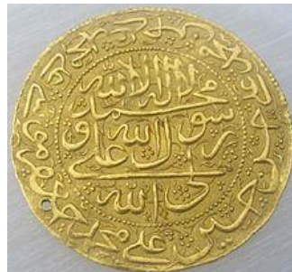
سکه شاه طهماسب دوم

نادر افشار (۱۱۴۸ - ۱۱۶۰) که در این زمان قدرت بلامنازع در ایران بود و عملاً تمامی اهرم‌های قدرت سیاسی و نظامی را در اختیار داشت در نوروز ۱۱۴۸ ق شاه عباس سوم را با تمهیدات پیچیده‌ای خلع و خود به سلطنت رسید اما چون کاروی دارای مشروعیت مذهبی نبود در دشت مغان مجلس مؤسسان عظیمی تشکیل داد که در آن حدود یکصد هزار نفر از بزرگان مملکتی را گرد آورد تا به وسیله آنان سلطنت خود را رسمیت دهد (مالکم، ۱۸۶۷: ۳۳) وی در محیط ارباب و تهدید حاکمیت را به دست آورد (۱۱۴۴) اما دیری نپایید که در مناطق مختلف ایران شورش‌هایی صورت پذیرفت که منجر به قتل نادر گردید (۱۱۶۰) پس از قتل نادر سرجنابانان و مدعیانی در صدد به دست آوردن قدرت برآمدند در حالی که هیچ کدام مشروعیت مذهبی لازم را نداشتند بازماندگان نادر و روسای ایلات هر کدام با پایگاه ضعیف اجتماعی و مذهبی که داشتند بخت خود را برای دستیابی به قدرت آزمودند اما به دلیل عدم مشروعیت مذهبی در جامعه ایران حتی مقتدرترین آنان کریم خان زند نتوانست بر تمامی ایران مسلط شود، در منازعاتی که بین مدعیان قدرت بوقوع پیوست در ابتدا آنان «مجبور شدند مانند نادرشاه افشار یک نفر از خاندان صفوی را به حکومت منصوب نمایند، ابوالفتح خان و علی مردان بختیاری و کریم خان زند پیمان سه جانبه‌ای منعقد کردند که بر اساس آن میرزا ابوتراب فرزند خردسال میرزا مرتضی صدرالصدور را که نواده دختری شاه سلطان حسین صفوی بود را با نام شاه اسماعیل سوم به قدرت رسانند و به نام وی سکه ضرب شد (شعبانی، ۱۳۷۸: ۱۶۰).