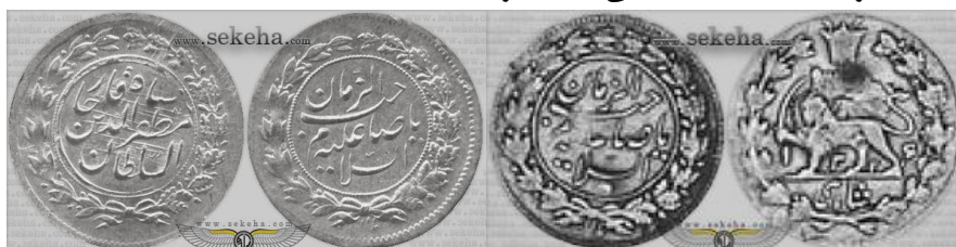
سکه صاحب الزمانی مظفرالدین شاه و محمد علی شاه قاجار