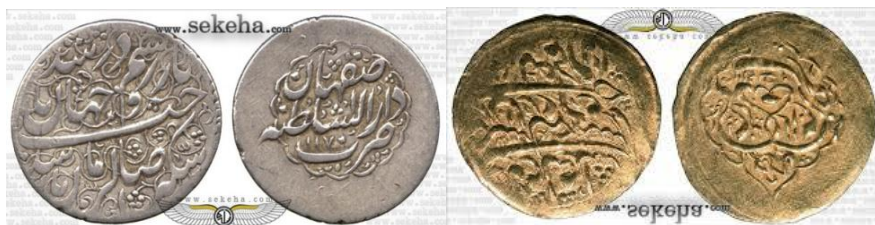
سکه صاحب‌الزمانی کریم خان زند سکه صاحب‌الزمانی صادق خان زند

علیمراد خان زند (۱۱۹۶ - ۱۱۹۹ هـ) پسر الله مراد خان زند بود که بعد از درگذشت کریم خان چندی با بازماندگانه وی به جنگ پرداخت و در ۱۸ ربیع‌الاول سال ۱۱۹۶ هـ به حکومت رسید و در ۲۸ صفر سال ۱۱۹۹ هـ فوت کرد رابینو از وی شش سکه معرفی کرده است که دو سکه طلا و چهار سکه نقره است در اکثر سکه‌های وی شعر: از سکه به حق صاحب‌الزمان "نقر شده است، جالب است که جعفر خان زند (۱۱۹۹ - ۱۲۰۳ هـ) بر خلاف بقیه حاکمان زند بر سکه خود نوشته است "یا امام جعفر صادق" که این سکه‌ها در نوع خود بی‌نظیر است و تنها سکه‌هایی است که نام امام جعفر صادق علیه‌السلام به صورت مستقل بر آن‌ها نقر شده است که این عمل به خاطر هم نامی جعفر خان با امام ششم علیه‌السلام صورت پذیرفته است.