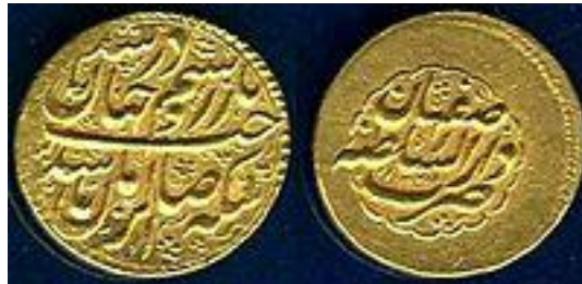
ضرب دار السلطنه اصفهان

ارومیه را تصرف کرد و به حکومت در قسمتی از آذربایجان پرداخت و مدعی تاج و تخت ایران گردید (گلستانه، بی تا: ۱۸۲ و ۱۸۴).