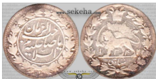
سکه صاحب الزمانی احمد شاه قاجار

در دوره پهلوی با این که آن حکومت سیاست‌های غیر مذهبی داشت اما برخی اوقات با توجه به فضا مذهبی جامعه و حوادث و رویدادها سکه و مدال‌هایی به نام امام زمان علیه السلام ضرب شده است، یک سکه به وزن ۲۱ گرم در نوروز ۱۳۳۳ شمسی ضرب گردید که بر روی آن نیمرخ محمدرضا پهلوی و ثریا اسفندیاری همسرش با تصویر تاج بر بالای سکه و در پشت سکه شعار "یا صاحب الزمان ادرکنی" نقش بسته است این سکه هفت ماه پس از کودتای امریکایی انگلیسی ۲۸ مرداد ۱۳۳۲ ضرب گردیده است، مورخ دانشگاه کمبریج از قول رابینو می‌نویسد که ضرب این سکه به خاطر خوابی بوده که محمد رضا پهلوی یکی از ائمه را به خواب دیده است (آوری، ۱۳۸۷: ۱۸۶) در حالی که کاملاً مشخص است پس از کودتای ۲۸ مرداد و سخت‌گیری‌های مذهبی و ضرب و شتم‌های به وجود آمده و سرکوب گروه‌ها و احزاب مذهبی مخالف مشکلاتی را به وجود آورده بود، محمد رضا پهلوی در صدد برآمد با ذکر شعارهای مذهبی از قبیل: السلطان علی ابن موسی الرضا و لافتی الاعلی لاسیف الاذوالفقار و یاصاحب الزمان تظاهر به مذهبی بودن نماید و نقر این شعائر بر سکه‌ها در همین راستا بوده است.