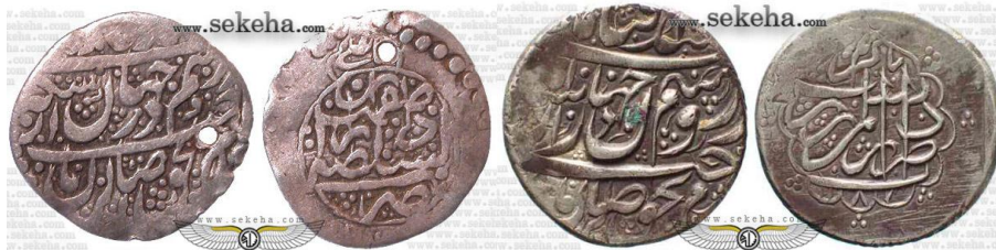
سکه صاحب الزمانی ابو الفتح خان زند