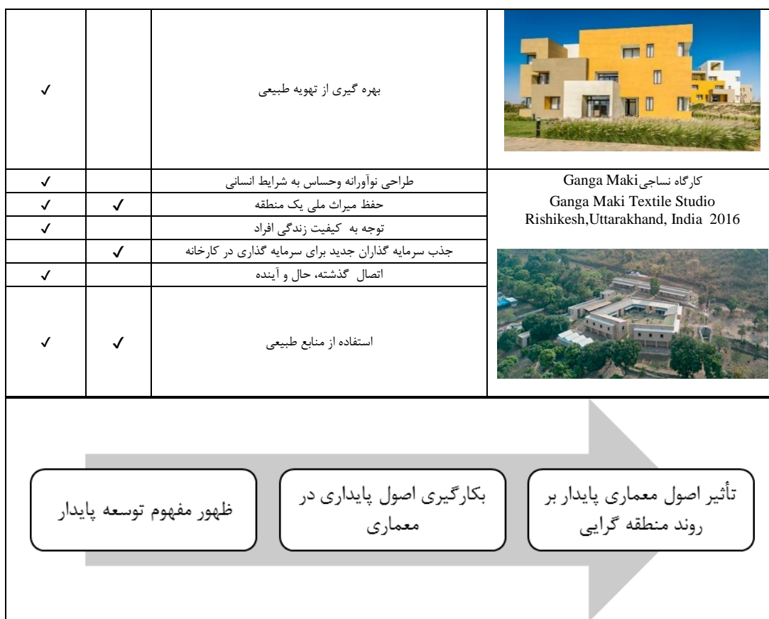
شکل (۳). فرایند تحول منطقه گرایي پایدار

الکساندر زونیس و لیان لفور در آخرین چشم انداز خود در باب منطقه گرایي، نمونه هایی از پروژه های اجرایی متفاوت در کشورهای مختلف دنیا را ذکر کرده و خاطر نشان می سازند که طی سال های واپسین قرن بیستم تا به امروز، تئوری معماری منطقه ای از منظرهای مختلف گرایش های زیادی گرفته و بسط یافته و با عملکرد خود نیز متناسب تر شده است. از تحلیل این آثار می توان به این نتیجه دست یافت که برخی از آثار منطقه گرایي امروز از رویکرد پایداری تأثیر پذیرفته و دارای ویژگی های پایداری هستند. همچنین با بررسی سایر آثار که در مجلات و جوایز معماری که در سال های اخیر از آن ها با عنوان معماری منطقه گرا یاد شده می توان تاییدی بر نظریه زونیس و لفور در مورد ویژگی های منطقه گرایي امروز باشد.