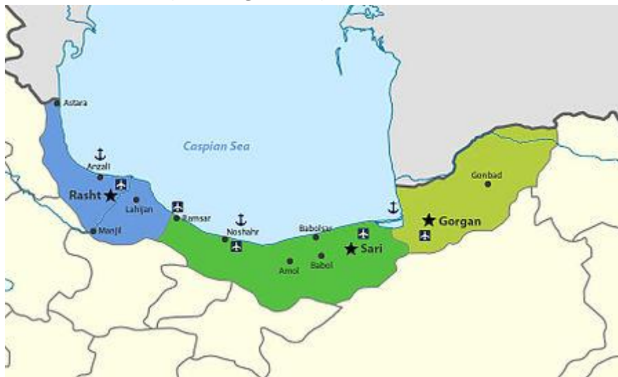
شکل (۱): موقعیت استان های ساحلی شمال ایران

محدوده ساحلی دریای خزر در ایران سه استان گیلان و مازندران و گلستان قرار دارند با بیست و پنج شهر و مجموع جمعیت ۰۵۵/۱۵۶/۲ و تعداد ۹۲۵/۷۱۳ خانوار شهر رشت با ۵۴/۳۱ درصد از کل جمعیت شهرهای نوار ساحلی دریای خزر و ساری با ۳۷/۱۴ درصد بیشترین جمعیت شهرهای نوار ساحلی را دارند (شفیعی حق شناس و همکاران، ۱۴۰۲: ۷۸). از مهم ترین بنادر ایران در ساحل دریای خزر می توان به بنادر ترکمن و گز در استان گلستان، بنادر امیرآباد، فریدونکنار و نوشهر در استان مازندران و همچنین بنادر مهم انزلی و آستارا در استان گیلان اشاره کرد.