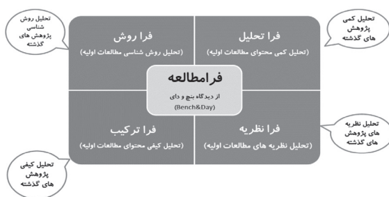
شکل ۱. انواع فرامطالعه از منظر بنج و دای (۲۰۱۰)

فرانظریه ۲ ، فراروش ۳ ، فراترکیب ۴ و فراتحلیل ۵ است. (بنج و دای، ۲۰۱۰: ۶)