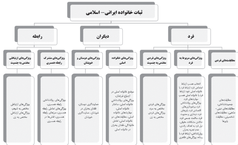
شکل ۵. الگوی ثبات زناشویی ایرانی-اسلامی