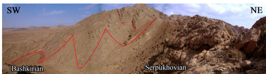
شکل ۳- نمایی از برش A سازند سردر در ناودیس چشمه شیر.

مرجان‌های مورد مطالعه از ۴ رخنمون و برش چینه‌شناسی A, B, C, D افق‌های نمونه برداری گردید (شکل ۲)، که این اجتماعات مرجانی در ۲ افق مرجانی مجزا یافت شدند: افق مرجانی اول با سبترای ۱-۲ متر از سنگ آهک میکریتی و چرتی سرشار از مرجان‌های روگوزا و تابولاتا تشکیل شده است (جدول ۱). این افق در انطباق با برش چینه‌شناسی زلدو و مطالعات ییواستراتیگرافی انجام شده در آن (به عنوان مثال: سهرابی، ۱۳۸۴؛ Badpa et al., 2016) به دیرینگی سرپوخوین پسین می‌باشد.