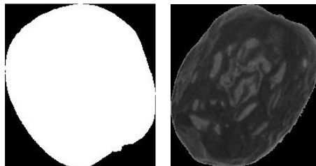
شکل (۲) تصویر سیاه و سفید استفاده شده جهت ویژگی‌های بافتی (تصویر سمت راست)، و تصویر باینری استفاده شده جهت ویژگی‌های شکلی (تصویر سمت چپ)

در قسمت دوم کار جهت بررسی ویژگی‌های بافتی در این تحقیق از عکس‌های گرفته شده در حالت سیاه و سفید استفاده شد (شکل ۲). البته برای بررسی کامل بر روی نمونه‌ها مقادیر مربوط به پس‌زمینه در عکس‌ها شناسایی و مقدار صفر به آنها داده شد تا پس‌زمینه به حالت کاملاً سیاه درآمده و از اجزای عکس حذف گردد. در شکل (۲) نمونه تصویر مورد استفاده جهت بررسی ویژگی‌های شکلی و بافتی مشاهده می‌گردد.